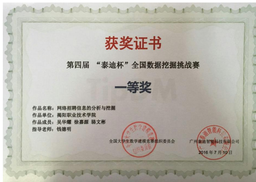
图 14 第四届全国数据挖掘挑战赛一等奖证书

我系学生积极参与广东省大学生挑战杯竞赛，获得一等奖 1 项，二等奖 1 项。大学生科技创新培育专项资金立项 2 项。