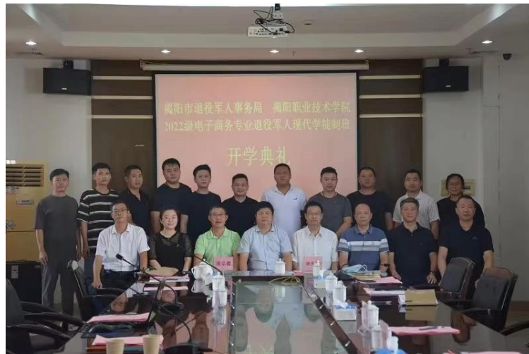
图 退役军人班开学典礼

依托学院优质教学资源，确定我校最具潜力和品牌效应的电商学院为 承办机构，开设“电子商务”专业，量身打造人才培养方案，确保试 点项目高质量完成。