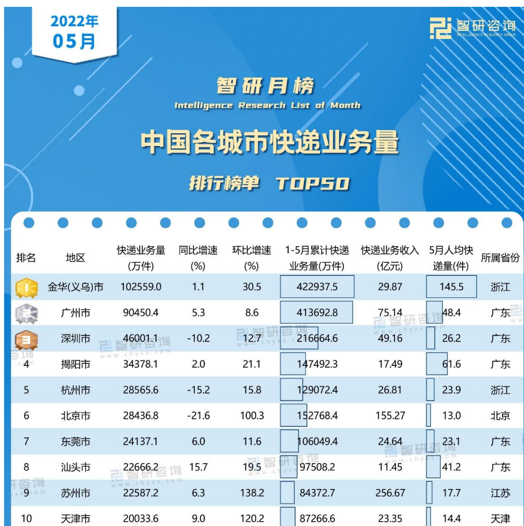
图 揭阳市快递业务量全国排名第四（数据来源：智研咨询）

2022年，揭阳市快递业务量全国排名第四，迸发出蓬勃的生命力，这背后离不开电子商务的告诉发展。截至2023年，揭阳已孕育出38个淘宝镇，数量居广东之首。作为粤东区域支柱产业的电子商务，基地以区域电子商务支柱产业为抓手，对接区域纺织服装、金属、医药、玉器、鞋业等传统优势产业、新兴产业和特色产业链，充分发挥产业优势，深化产教融合，打造人才培养、科学研究、技术创新、企业服务、创新创业等功能于一体的人才培养新模式。