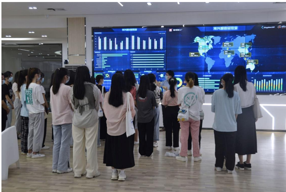
图 学生参观绿色石化 5G 智慧生产线

同时基地作为区域人才赋能的重要主体，积极打造产教实质性融合的平台，培养支撑“双十”产业集群的电子商务高技能人才，打造集教学、培训、职业技能鉴定和技术服务于一体的技术技能型人才培养高地、服务区域经济的典范。