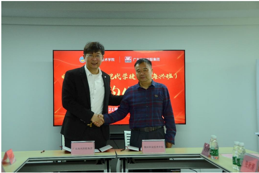
图 现代学徒制班签约仪式