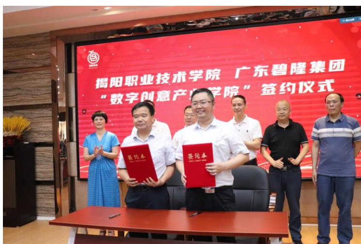
图 基地与广东碧隆集团共同成立数字创意产业学院

基地围绕“产业数字化转型升级”，以电子商务为抓手积极推动融湾建带，把“湾”“带”机遇转化为振兴发展的强大动力。基地精准对接广东省“双十”战略型产业集群中的绿色石化产业集群、智能家电产业集群、数字创意产业集群，以服务粤东“双十”产业集群发展、服务国家乡村振兴战略为双目标，聚焦中国(揭阳)跨境电子商务综合试验区建设，与绿色家居大型龙头企业、智能家电龙头企业开展产学研合作，以电子商务带动解决产业商品销售的“最后一公里”。