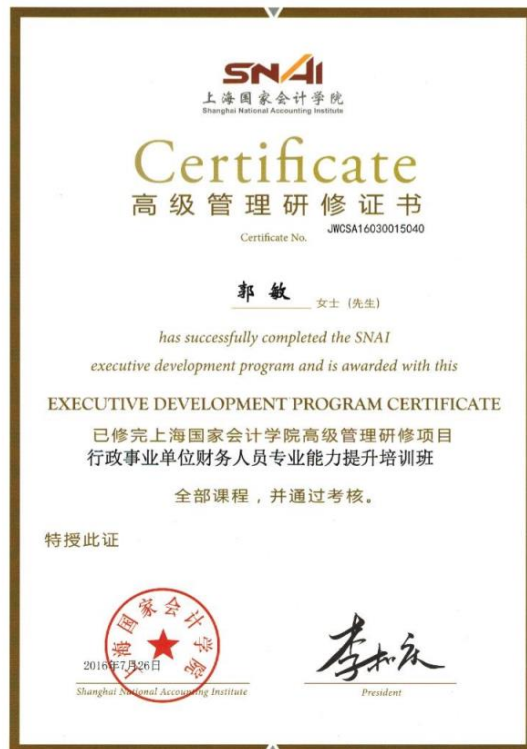
虚拟仿真项目相关的省厅级进修、培训情况部分证书佐证